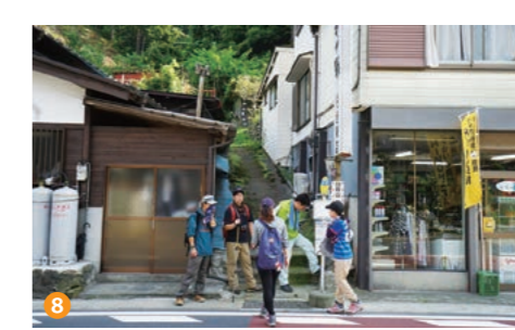
8 数馬の湯 9 数馬の湯

神社から10分ほど下ると電波塔がある開けた尾根へ出て、榎原の山々を見渡せます。さらに15分ほど下ると2番目の電波塔があります。滑りやすい岩場もあるので慎重に下って、尾根道から右に折れ、野草が生い茂る沢沿いを15分ほど下ると元郷バス停へ到着です。