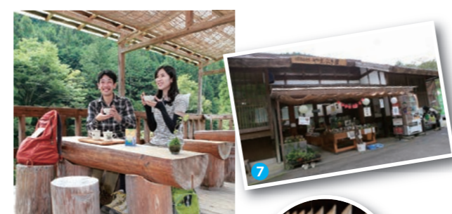
7 数馬の湯 8 数馬の湯

続いてコース最高標高1019mの茅丸を経て進行峰までは、急な上り下り坂を繰り返すので慎重に。進行峰の分岐を左に折れ柏木野バス停へ向かって下ります。途中道が途切れているように見える急坂もありますが、まき道も利用できます。約2時間下り、橋を渡ると柏木野バス停へ到着。車道を東に10分ほど下ると特産物直売所のやまぶき屋があります。バスが来るまでテラスでひと休みするのもおすすめです。