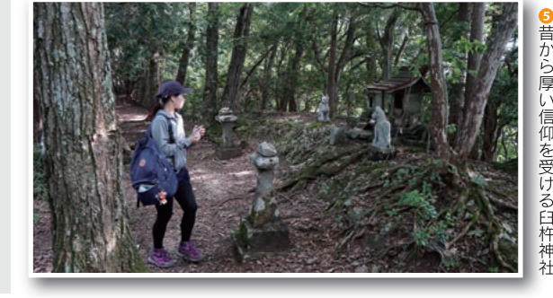
9 昔から厚い信仰を受ける白杵神社

※所要時間は目安です。休憩時間は含まれていません。体力を考慮し、時間に余裕をもったハイキングをお楽しみください。