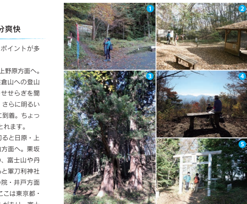
1 車道から登山口へ。見落とし注意 2 つろげる峠の広場 3 浅間峠の夫婦杉 4 右に富士山が見え始める 5 お参りして振り返ると富士山が 6 三国山からの富士山もすてき

榎原産のじゃがいもはもちろん、これを加工したクッキーや焼酎などおいしいと評判。ゆずワインや蜂蜜、こんにやく、わさび漬なども人気です。やまぶき屋では季節の野菜や山菜も購入できます。