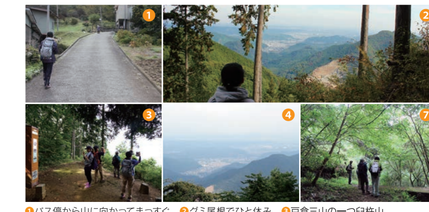
1 バス停から山に向かってまっすぐ 2 グミ尾根でひと休み 3 戸倉三山の一つ白杵山 4 あきる野や埼玉の町並みが 5 涼しい沢道

白杵山の山頂付近に位置する白杵神社は、応永4年(1397)坂本兵衛佐繁宗によって機立(柏木野地区)に建てられましたが、悪夢のお告げによって永禄3年(1560)に現在地へ移されました。農業・養蚕の守護神が祭られており、昔は広い範囲の人々から信仰されていました。現在は毎年5月5日に祭事が行われ、地区内役員で管理されています。(出典『榎原村史』昭和56年3月30日発行より)