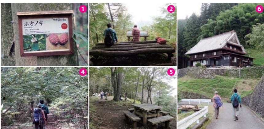
1 木の名前や特徴を学べる 2 北側の山々をパノラマで 3 山梨側の尾根を見渡す。右に見えるのは富士山 4 美しい緑の中を森林浴気分 5 晴れていればここからも富士山が 6 数馬集落の佇まいも魅力