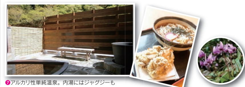
● アルカリ性単純温泉。内湯にはジャグジーも

※所要時間は目安です。休憩時間は含まれていません。体力を考慮し、時間に余裕をもったハイキングをお楽しみください。