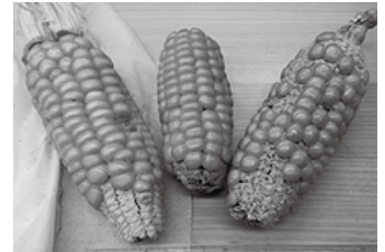
昔のトウモロコシ

檜原村では、今は見ることが出来なくなった昔から種を継いでいる方をずっと探しています。それで、7月中は檜原村では「馬の歯」と呼ばれる白いトウモロコシなどを探していましたが、なかなか見つからず。こうして調査を続けるのは、村の観光の在り方として新しいものばかりではないからです。昔の暮らしそのものが今街中で暮らす人にとって珍しいものであり、関心が高い部分でもあるので、檜原村の魅力は暮らしにこそあると考えて、取り組んでいます。何か情報がありましたら、教えていただきたいです！