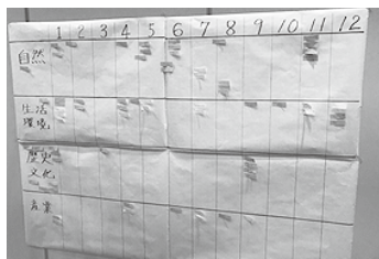
大いに盛り上がったプチ宝探し！！

さて7月に入りまして、ついにエコツーリズム事業の一つである「宝探し」調査に動き始めました。協力隊のエコツーリズム担当として旧8学区ごとの説明会すべてに同席させていただきましたが、我々の予想を超えるほどに多くの住民の方々にご参加いただきまして、村民の観光・村づくりに対する関心の高さがうかがえました。今回のアンケート調査に併せて、個別にご自宅等に伺ってみなさまから直接お話しをお聞きしたいと思っておりますので、その際はどうぞよろしくお願いたします！