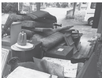
家主さんと一緒に家財の片付け

さて、みなさんにお知らせです。ご縁がありまして、6月から三都郷千足の空き家をお借りすることになりました。そこを自身の事務所としつつ、シゴトバや拠点が必要な個人に向けてのシェアオフィスとして活用していきます。愛称は、「ひのはラボ」です！ラボ（Lab, Labo）とは「研究所・研究室」の意で、地域との関わりのなかで多種多様な人が試行錯誤しながら自分の得意な分野から檜原村の地域振興・地域活性化に取り組むための交流拠点をしたい、という思いから名付けました。まずは改修・掃除に取り掛かり、終わり次第少しずつ仕事ができるような環境に整えていく予定です。住居は引き続き上元郷ですが、千足をはじめ近隣の方々にはこれからお世話になることと思います。どうぞよろしくお願い致します！！