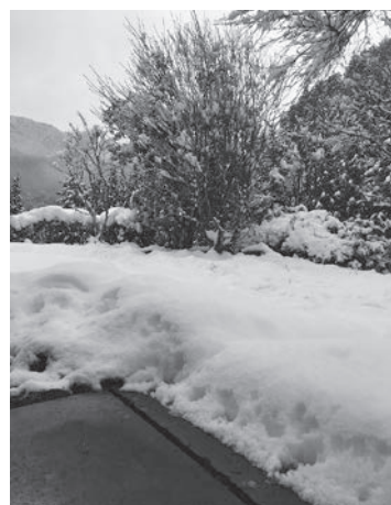
家の前に積もった雪

そして寒さで糖分を増した美味しい白菜を色々な方からいただきました。私にとって冬と言ったら「掘りごたつであったか白菜料理」になりました。来年はどんな冬になるのか楽しみです！！