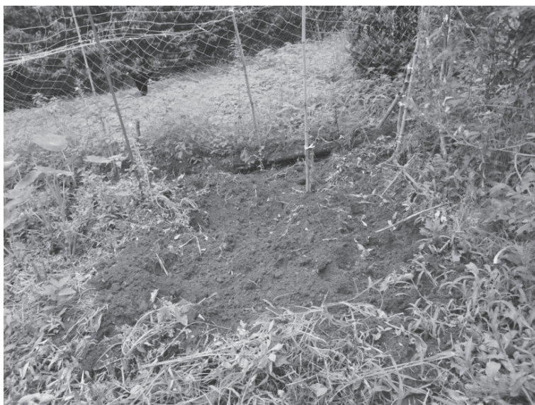
↑イノシシに荒らされた畑

【対象となる電気柵】 ネット型、簡易なイノシシ用など農地へ有害鳥獣の侵入を防ぐ鉄柵や電気柵・音や光を発する鳥獣撃退器であればタイプは問いません。