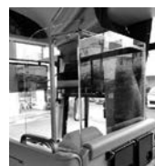
運転席の亚克力板 西東京バス(株)