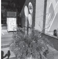
昨年の役場前の門松