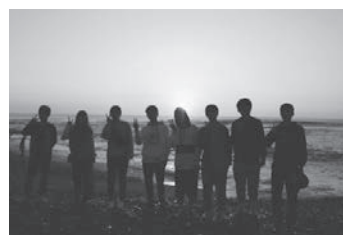
大洗海岸の日の出