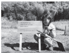
看板をたてました♪

2021年、あけましておめでとうございます。昨年は誰もが今までに経験したことのない生活環境の変化の年でしたね。生活様式の変化にも柔軟でむしろ最先端な檜原村の生活スタイルは、私のこれからの生き方を考える上で良いお手本でした。私は今年、協力隊卒業にむけての最後の1年になります。昨年、畑を使わせてもらいハーブを植えました。「ひのはらハーブ&スパイスガーデン」と看板を立てました!沢山苗を増やして、見ても楽しんでもらえるような畑にしたいと思っています。そして卒業後のカフェづくりにむけて本格的に進みたいと思います。皆様、本年もどうぞよろしくお願いいたします。