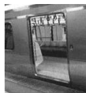
半自動ドアの自動開扉 東日本旅客鉄道(株)