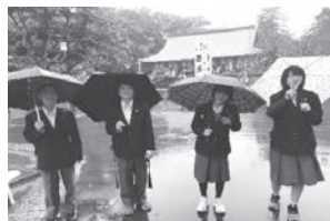
班行動で喜多院へ

小江戸川越の文化財や風土に触れ、日本の歴史や文化についての関心を高めるとともに、檜原村との違いを知る旅になりました。あいにくのお天気でしたが、みんなで協力して初めての班行動を成功させました。そして、吹きガラス体験で世界に一つだけの作品を作りました。