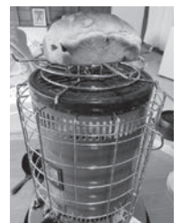
ストーブでパンを焼き始めました。

あけましておめでとうございます。今年は丑年、アレルギーで牛肉が食べられませんが、元気にやっていきたいです。さて、令和も早や3年目を迎えましたが、みなさんはどうお過ごしでしょうか。檜原村に来て2年目の冬になるとだんだん寒さに慣れてきたわけで、私は楽しく過ごさせてもらっています。おもちゃ美術館も着々と工事が進んでおり、先月は上棟式も終え、本格的に内装工事が始まっております。私たちも負けじと工房をフル稼働させて頑張っております。去年はお料理道具からおもちゃ、家具まで幅広くものづくりをさせていただきました。今年も面白いものをたくさんつくっていききたいと思いますので今年もよろしくお願い致します。