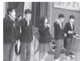
パーカッション体験