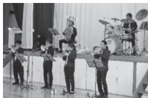
力強い演奏に感動

金管楽器とドラムスによるジャズユニット『ザ・ジョイフル・プラス』の6名をお招きし、スタンダード・ジャズを中心に、ポップス、ラテンを織り交ぜた、本格的なジャズ演奏を聞かせてくださいました。後半には打楽器の演奏体験で、プロの皆さんとともに音楽を作ることができました。