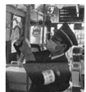
バス車内の消毒 西東京バス(株)