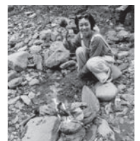
川で焚火を楽しみました♪

新年あけましておめでとうございます。皆さんいかがお過ごしでしょうか。 私は記念すべき初めての檜原村での年越しでした。去年、檜原村に引っ越しをしてから半年が過ぎ、人生がガラリと大きく変化した年となりました。毎日自然に触れ、村民の皆さんと関わらせていただき勉強になることばかりでした。皆さんにあたたかく迎えて頂き、とても充実した日々を送ることが出来ました。有難うございました。 今年の抱負は、檜原村の魅力を私らしく発信していくことです。今年は何んな一年になるでしょうか。やってみたいことが沢山!今年一年も私らしく駆け抜けます。本年もどうぞよろしくお願いいたします。