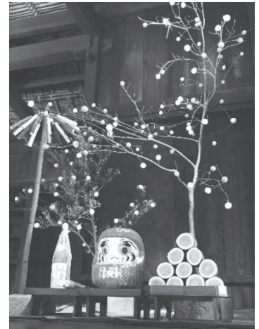
みんなで作った小正月飾り

1月に小正月飾りを作りました。恥ずかしながら、檜原村に来て初めて小正月という行事を知りました。そしてあーぼ・へーぼ、まゆ玉、米俵、鬼たたき棒など小正月には欠かせない飾りもたくさん！一つ一つに昔からの意味があることを知り勉強になりました。材料調達から飾りつけまで体験できてとても楽しい時間でした。