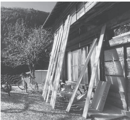
木材乾燥中。太陽ありがとう！

昨年12月は、雨量も少なく払沢の滝も凍る程の異例の寒さでしたから、今シーズンは一段と寒さ厳しい檜原村です。2月に入り、寒さ本番というところでしょうか。朝、目を覚ますと白い息が…。外の方が暖かいのではないかと思うくらい家の中も寒すぎて布団から出るのがつらい毎日。昼でも水が冷たすぎて、融雪剤まみれの愛車の洗車もためらう休日。まだまだ続く檜原村の冬の寒さに全く慣れずにいる私ですが、冬の晴れた日には、透き通った青空に癒されながら太陽の暖かさを身に染みて感じているこの頃です。