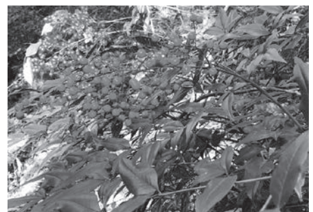
南天の実があちらこちらで見れました

2月3日は二十四節気では立春、一年の始まりとなりますが、実際は寒い！春のイメージとは逆で、一番寒い時期ですね。家にこもっているこの期間は、春には何を植えようかなど考えている人もいないのではないのでしょうか。まさに1年のスケジュー