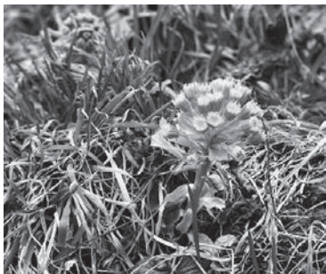
庭に生えたふきのとう

ふきのとうが出てきて、冬も大詰めになってきました。ふきの とうの天ぷらが楽しい季節です。今年も例年通り、氷点下を下 回る寒い季節になり、水を扱うにはつらい季節だと思います。さて、 おもちゃ美術館も順調に工事が進んでおり、建物らしくなってい きました。おもちゃ工房も負けじと快調に進み、来年の美術館の什 器作りの準備もばっちりです。今年もコロナの影響が続いていま すが、元気にやっていきたいと思っています。