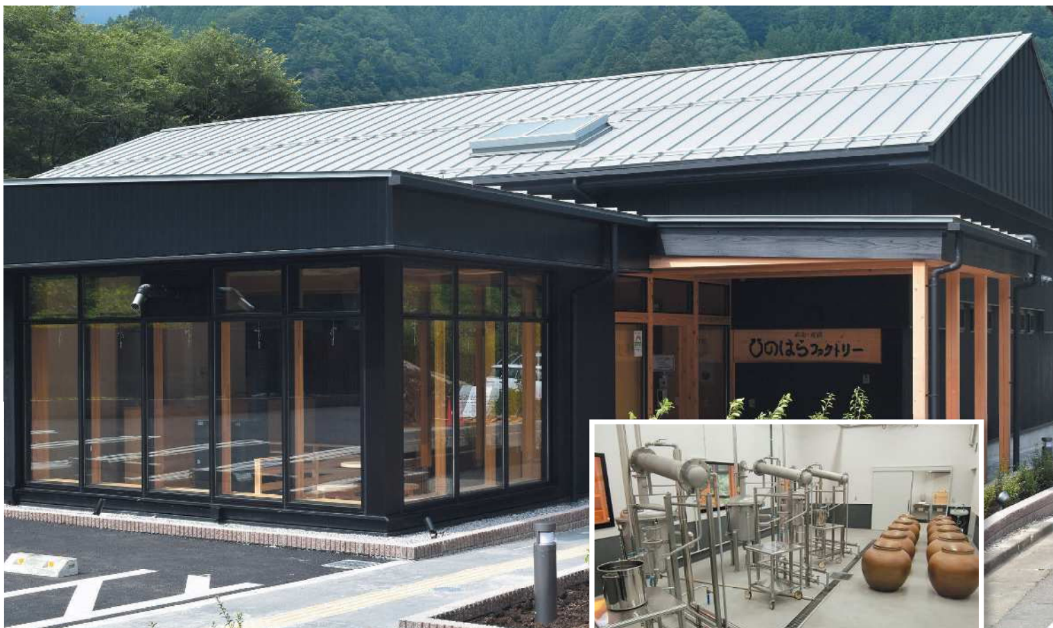
檜原村じゃがいも焼酎製造等施設 【ひのほらファクトリー】