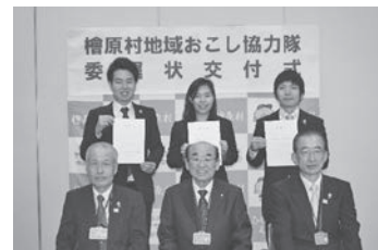
4年前の協力隊初日の写真です！

これからも檜原村で女性限定のシェアハウスの準備を進めていきます。私が檜原村に移住し、たくさんの方に良くして頂き、充実した村生活を送ることができました。そんな生活をいろいろな女性の方にも味わってもらい、村に移住する人を増やしていきたいです。