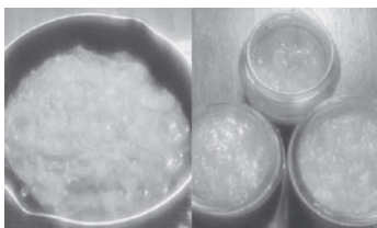
初挑戦のゆずジャムです♪

先月、ゆずの収穫について掲載しましたが、その後、ゆずジャム作りにチャレンジしました。ヨーグルトにトーストに、しばらく美味しいゆずジャムライフを楽しめそうです♪ 皆さんおすすめゆずジャムレシピ、教えてください。