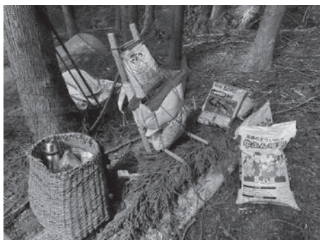
愛用の籠と梯子。ただ、次はパーカー（運搬車）が欲しいです。（笑）

山を見れば、無尽蔵にも思える体力と気力の軌跡。スギの植わっているところは、炭焼きをして植林した場所だと聞きました。山歩きは日常で、荷物を担いで登るなんて当たり前。陽当たりの良い場所は住みかよりも畑に。よく耳にする「今はスギ林だけど、昔は一面畑だった。」「この山の上に平があってね。昔は肥えを担いでみんなで登ったんだよ。」と。