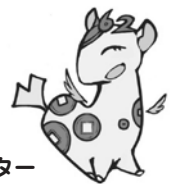
個人住民税PRキャラクター ぜいきりん