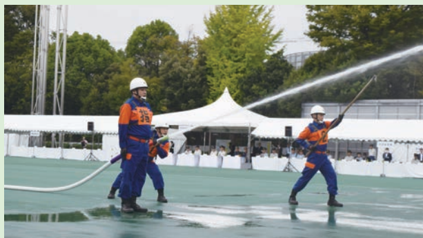
東京都消防操法大会