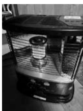
今年初めてのストーブ 灯油のおいが落ち着きます