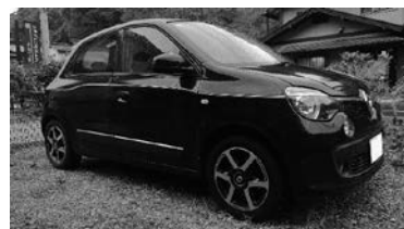
冬タイヤに履き替えて、違うホイールになっているかもです