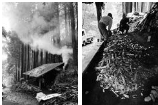
炭焼き小屋と焼けた白炭

こんなにも一年が経つのが早いと感じたのは初めてです。と、昨年も書いた気がします。それほど檜原村での暮らしが楽しく、あっという間に協力隊期間も終わってしまいそうです。そんな残りわずかになってきた協力隊活動の中から、先日は都民の森の炭焼き体験のお手伝いに行かせていただきました。昨年に引き続き二度目の炭焼きです。作業の手順は分かってきても、窯の温度や空気量をコントロールして行う燃焼の駆け引きのタイミングが難しいです。煙の色を眺めては、色が変わってきた気がして、「色が変わってきました！」と言うと「まだまだ。」と言われるやり取りを何度もしながら、「煙と火とする」にらめっこの時間が好きです。今年は昨年より多くの炭ができました！