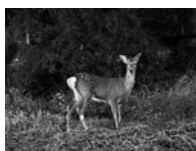
近所に出没したシカ

檜原の野生動物に遭遇する機会が多くなったように思います。サルは、村内どこに行ってもいるようで、3日に一回はみているような気がします。先日、家の近くで大きなシカを見ました。北海道では散々エゾシカを見ましたが、檜原のシカは初めてです。おしりの斑点が可愛かったです。しかし、雄シカの大きな角は凶器になるようで、事故も発生しているので気をつけたいと思います。