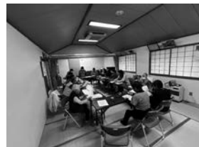
いきいきサロンにも変わらず参加しています！

協力隊の任期は残すところ1年と4か月なので、残りの期間も頑張っていきたいと思います！